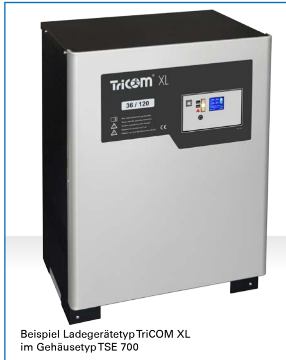
Beispiel Ladegerätetyp Tricom XL im Gehäusetyp TSE 700